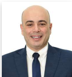
Pr Essam Fakhery Ebied